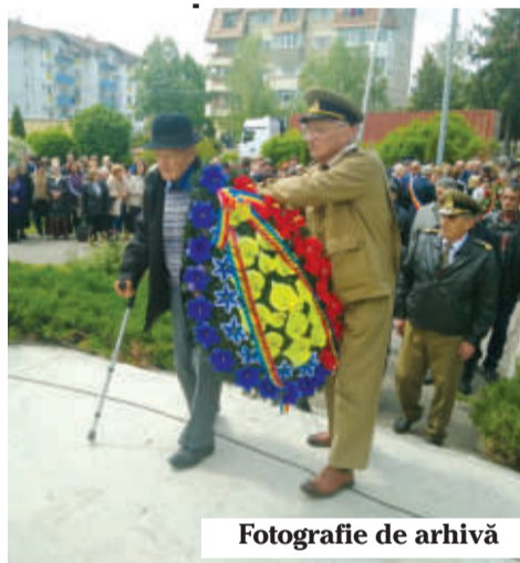
Fotografie de arhivă

Îi dorim cu toții multă sănătate veteranului nostru de război!