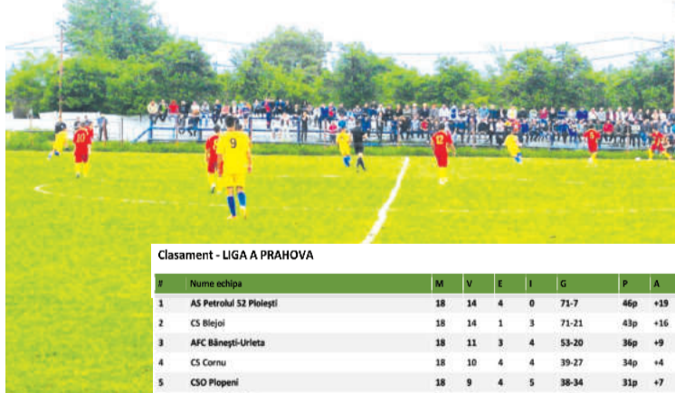
Clasament - LIGA A PRAHOVA

totul se întâmplă conform planurilor, și cum conform zicalei ce începe bine se termină prost, au urmat două jocuri pe teren propriu de unde s-a obținut doar un punct din șase posibile. Sperăm la un reviriment în următoarele etape, pentru a nu pierde contactul cu prima jumătate a clasamentului Ligii "A" Prahova.