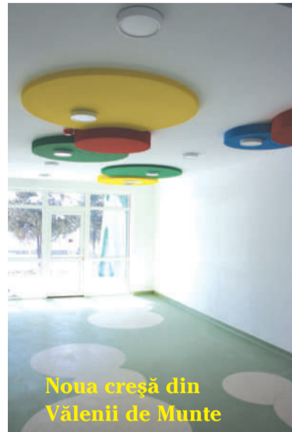
Noua creșă din Vălenii de Munte

f) Dotări în secțiile Spitalului: laborator analize;