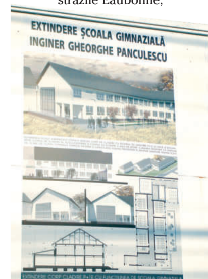
EXTINDERE ȘCOALA GIMNAZIALĂ INGINER GHEORGHE PANCOULESCU

Miriștei, Zorelor, Rizănești, Mihai Bravu, Aleea Mioriței și Cimbrisor;