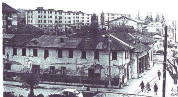
Casa Craioveanu (acum se află blocul cu Bancpost)