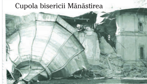
Cupola bisericii Mănăstirea