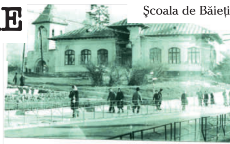
Școala de Băieți

Începând cu acest număr de ziar ne propunem o întoarcere în timp prin imagini rămase de la maestrul Bebe Dimitriu.